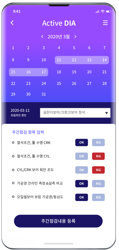
주간점검 항목 입력 주별 점검 항목의 OK/NG 체크, 특이사항 입력 가능