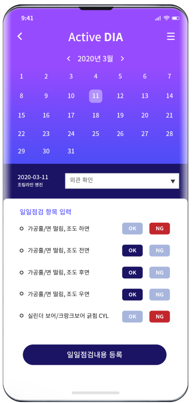
일일점검 항목 입력 일별 점검 항목의 OK/NG 체크, 특이사항 입력 가능