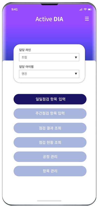
메인화면 일 별, 주 별, 월 별 점검 항목들을 실시간으로 체크하여 결과 확인 가능