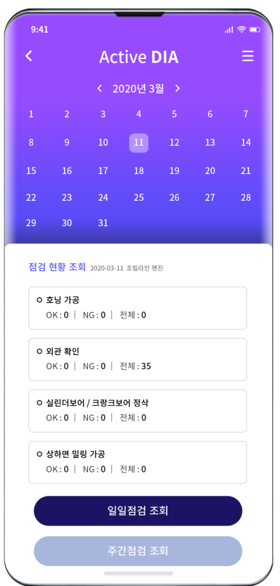
점검 현황 조회 일일/주간 점검 현황을 아이템별로 OK/NG/전체 건수로 표시