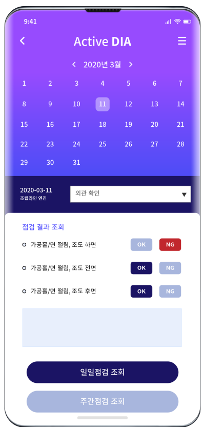
점검 결과 조회 일/주별 수행한 점검의 세부 결과 조회 가능